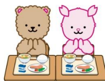
開校70周年記念キャラクター さくらぐま 花さかぐま